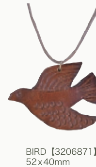
BIRD 【3206871】 52x40mm