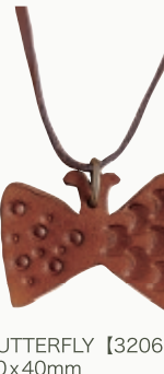
BUTTERFLY 【3206985】 50x40mm