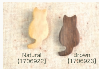
Natural 【1706922】 Brown 【1706923】