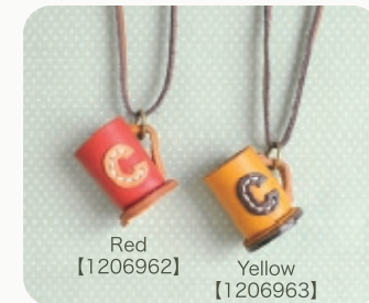
Red Yellow 【1206962】 【1206963】