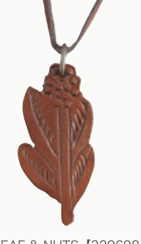
4LEAF & NUTS 【3206984】 30x65mm