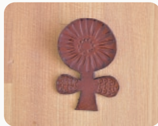
FLOWER A 【3206801】 40x58mm