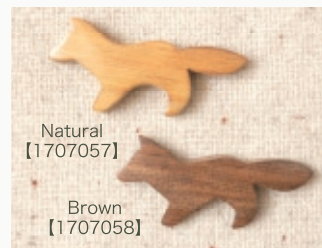
Natural 【1707057】 Brown 【1707058】