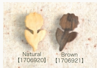
Natural 【1706920】 Brown 【1706921】