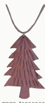
TREE 【3206869】 40x60mm