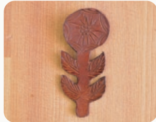
FLOWER C 【3206803】 30x70mm