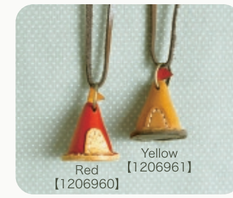
Yellow Red 【1206960】