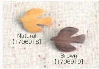
Natural 【1706918】 Brown 【1706919】