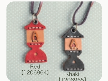
Red Khaki 【1206964】 【1206965】