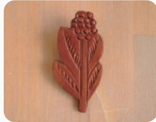
4LEAF & NUTS 【3206980】 30x65mm