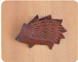
HEDGEHOG 【3206807】 55x38mm