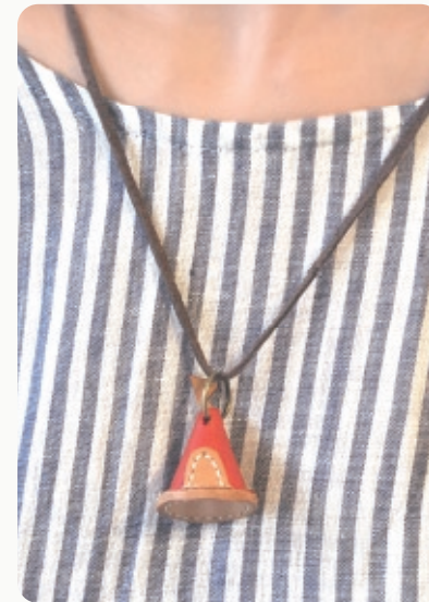
レザーネックレス Motif 2,500yen (税別) Neck 900mm