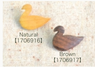
Natural 【1706916】 Brown 【1706917】