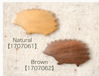
Natural 【1707061】 Brown 【1707062】