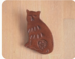
CAT 【3206983】 40x55mm