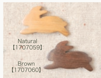
Natural 【1707059】 Brown 【1707060】