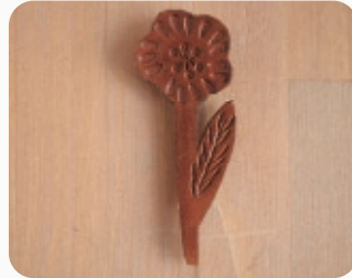
LONG FLOWER 【3206982】 30x80mm