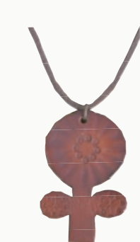
FLOWER A 【3206868】 40x58mm