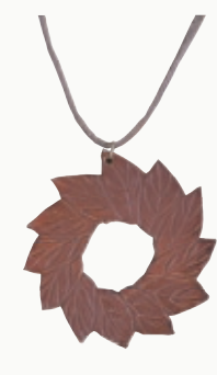
LEAF RING 【3206870】 50x50mm