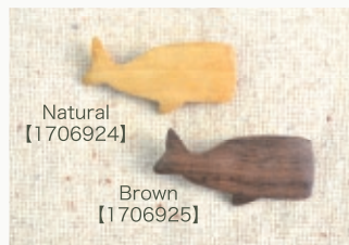
Natural 【1706924】 Brown 【1706925】