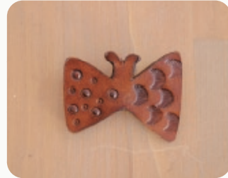
BUTTERFLY 【3206981】 50x40mm