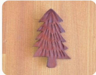
TREE 【3206805】 40x60mm