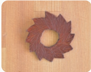
LEAF RING 【3206806】 50x50mm