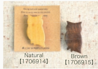
Natural 【1706914】 Brown 【1706915】