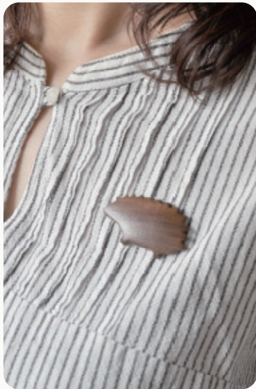
Natural - APRICOT Brown - SAAJ TREE